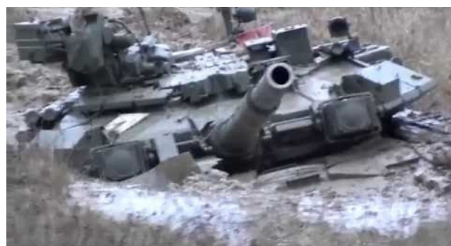
ruský tank v ukrajinských bahenních lázních

Ruský generální štáb Putinovi: Dobré zprávy, Ukrajina přišla o další dvě střely Neptun a my máme dvě nové ponorky!