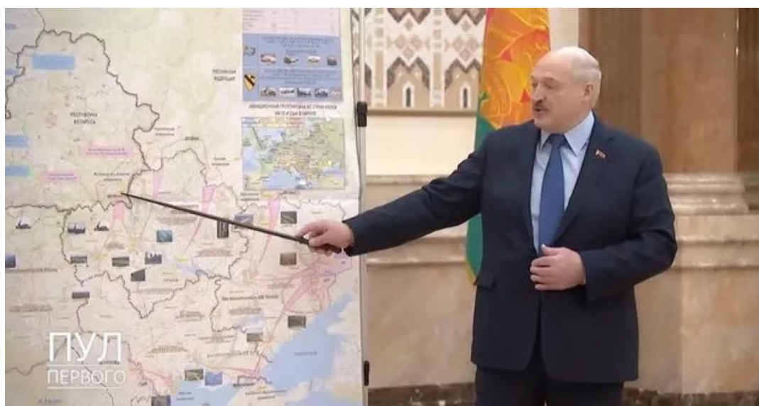
Lukašenko ukázal tajný plán v televizi

Odpověď: Ne, není to pravda. Ruští vojáci hrají na Ukrajině zábavnou vědomostní hru „Poznej tajemný předmět“. A protože většinu z těchto věcí doma nikdy neviděli, musíte uznat, že si výhru právem zaslouží.